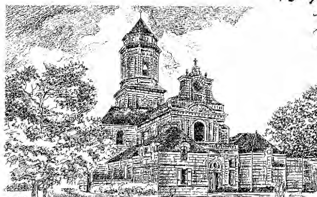
N°43103 - SAINT-FLORENT-LE-VIEIL - Eglise Abbatiale